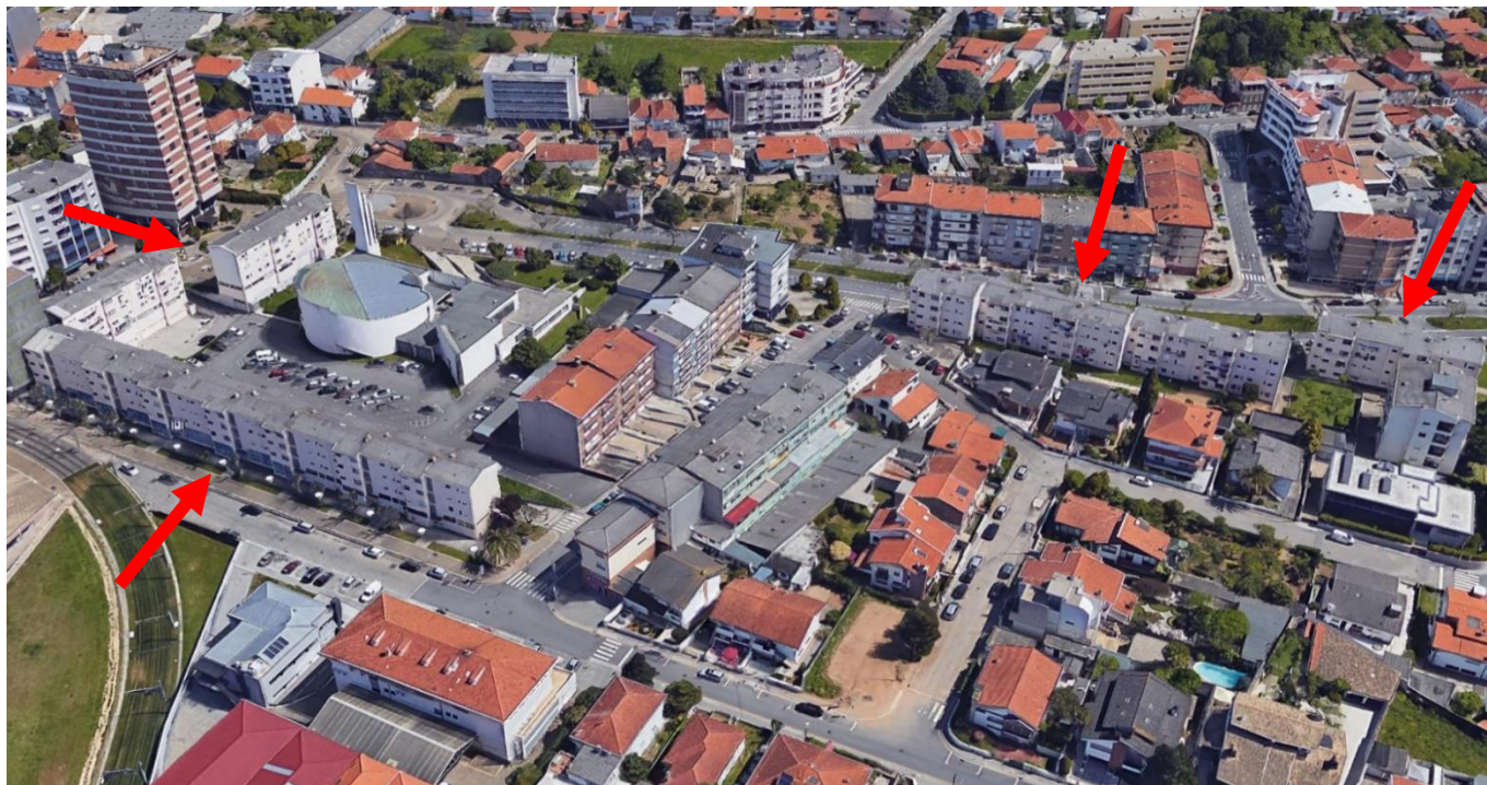
Imagem – Vista geral dos empreendimentos Maia I e Maia II, no centro da Maia (fonte: Google Earth)